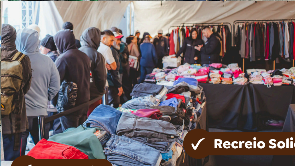
✓ Recreio Solidário