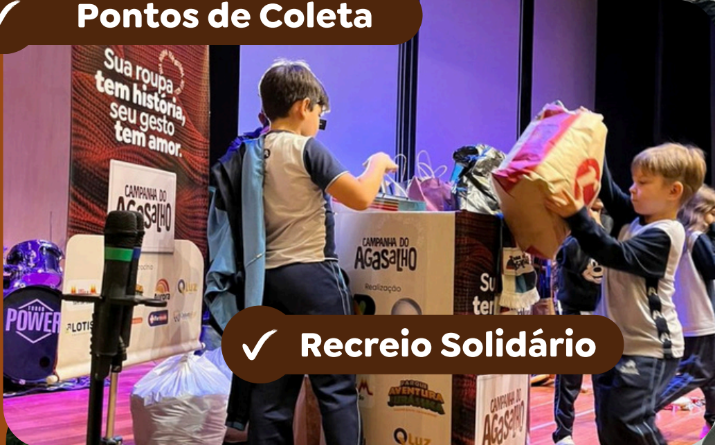
✓ Recreio Solidário