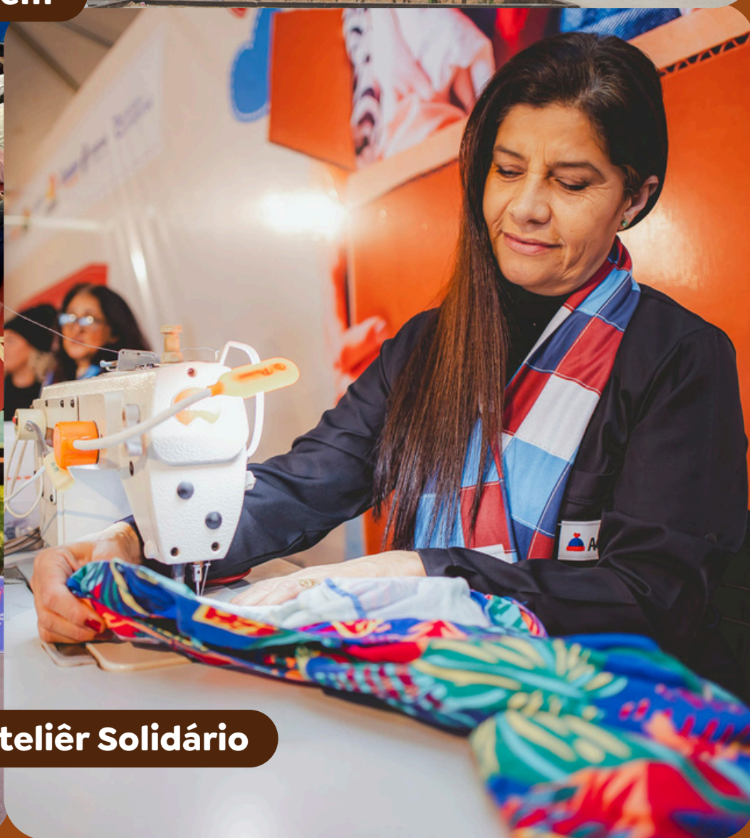
✓ Ateliê Solidário