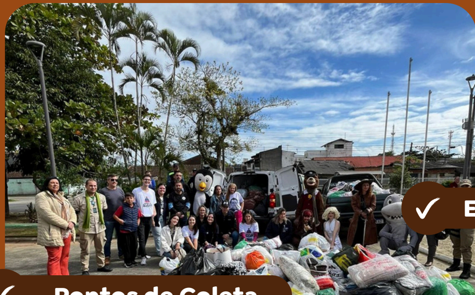
✓ Pontos de Coleta