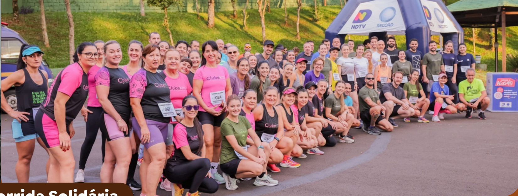
✓ Corrida Solidária