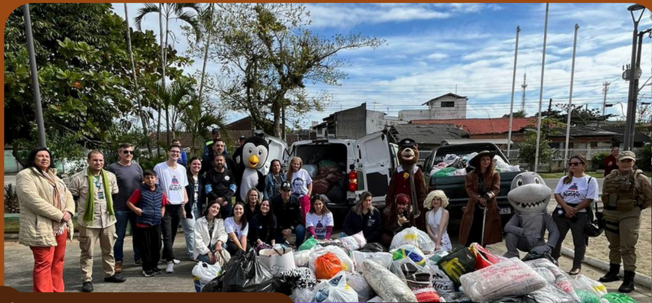
✓ Pontos de Coleta