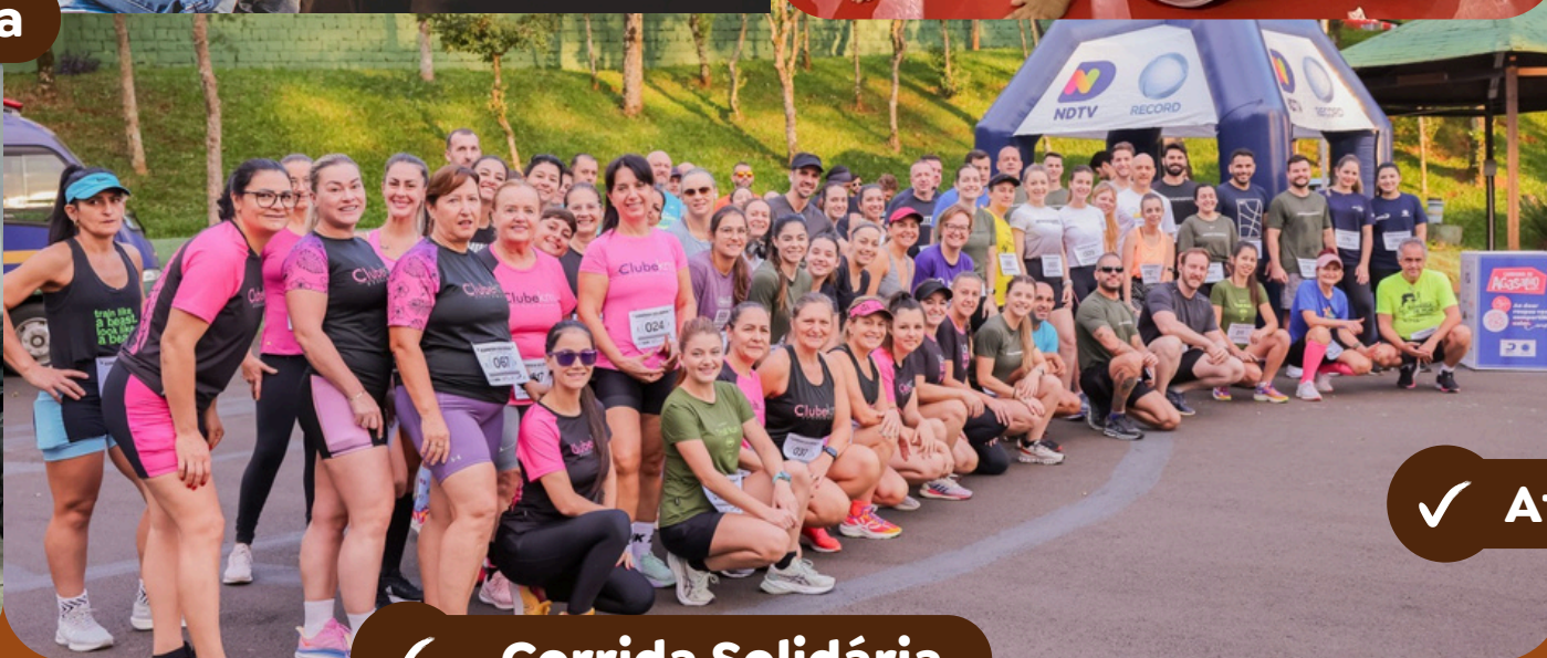
✓ Corrida Solidária